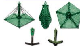
ПСП-мм подвесные эвакуа- ционные платформы для вертолета. Для случаев, когда приземление невозможно 2-4-10 местные