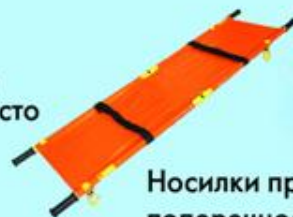
Носилки продольно- и поперечноскладные