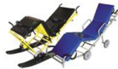
НК-мм 0702 носилки кресельные; исполнение с лыжами и боковыми ограждениями