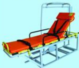
Мобильный медицинский модуль