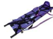
НПС-мм 0301 носилки продольно складные для вертикальной эвакуации на стропях