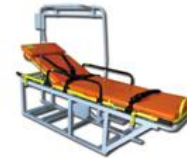
ММВ для КА-226Т медицинский модуль (макет без аппаратуры)