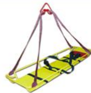
НЖ-мм 0832 носилки лоткового (корзи- ночного) типа с жесткой панелью, привязные ремни, стропы (опция)