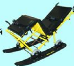
Кресельные носилки трансформирующиеся, устанавливаются на место пассажирского кресла (положения "сидя", "лёжа", "полулёжа")