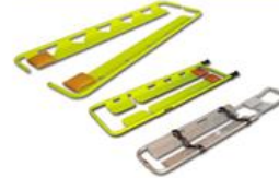
НКРЖ-мм 0501, 0502, 0503 носилки ковшовые (ортопедические) продольно разъемные с жесткой панелью