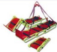
НЖ-мм 0806 носилки волокуша ранцевые горноспасательные, с жесткой панелью, привязные ремни, стропы (опция)